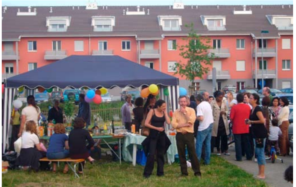
Photo: La fête des voisins à Bellevue, le 27 mai 2008

P uisque le thème de la mobilité est de saison et sert de fil d'Ariane à BdA, je partage avec vous un heureux constat : « ça bouge à Bellevue ». Eh oui, entre la magnifique semaine de la diversité réalisée dans le cadre scolaire avec une participation record des parents et familles de plus de 60 nationalités et la fête des voisins qui a été très fréquentée par les habitants du haut de Bellevue (voir photo), BdA constate avec plaisir qu'il y a une véritable volonté de faire bouger les choses à Bellevue en allant « doucement » à la rencontre des uns et des autres.