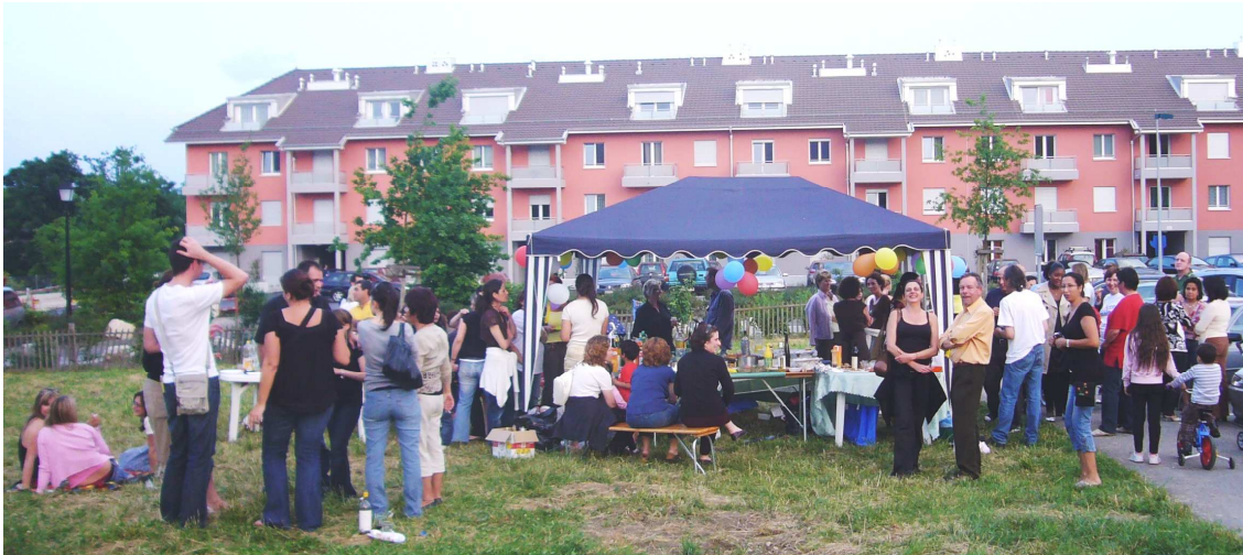
Fête des voisins 2008

* BdA met à votre disposition des bancs, des tables sous tente et des boissons. Vous apportez une de vos spécialités. Information complémentaire: Raline Entakli, 774 09 56; Lucy Anklin, 774 1255